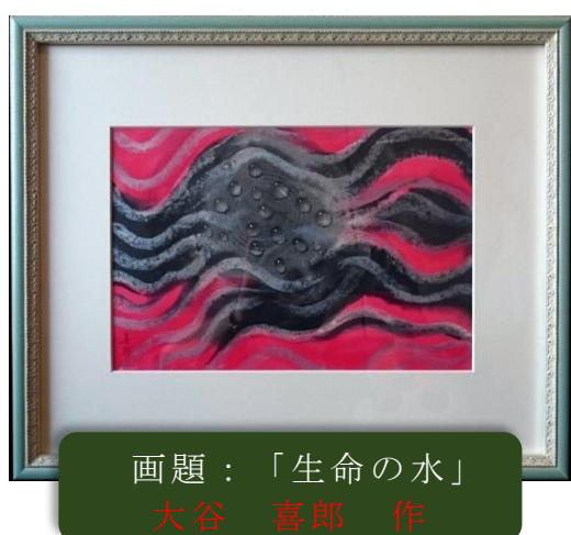
画題：「生命の水」 大谷 喜郎 作