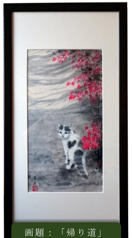
画題：「帰り道」 大谷 喜郎 作

第19回 雪舟国際美術協会展 特選 第21回雪舟国際美術協会展 文部科学大臣賞 等多数