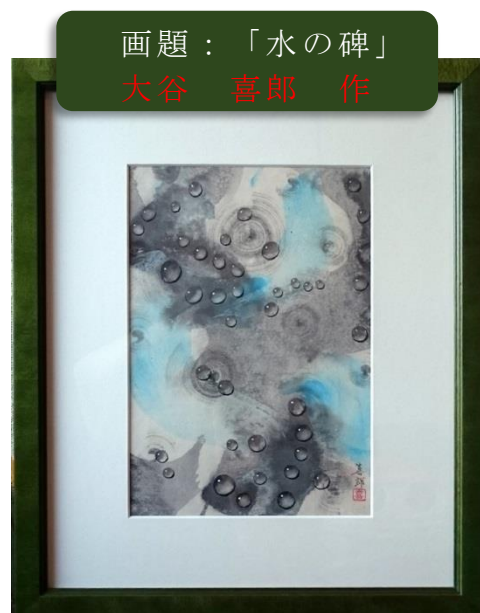
画題：「水の碑」 大谷 喜郎 作