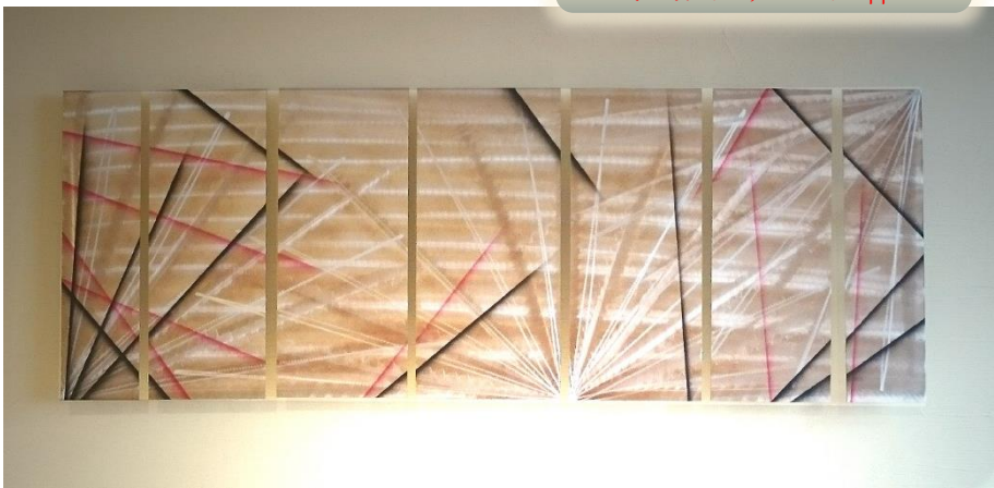
メタルアート ジョンアレン作

見る角度、照明度合が少し違うだけで、重層的に光が流れるように見え、三次元的な表情をかもし出します。